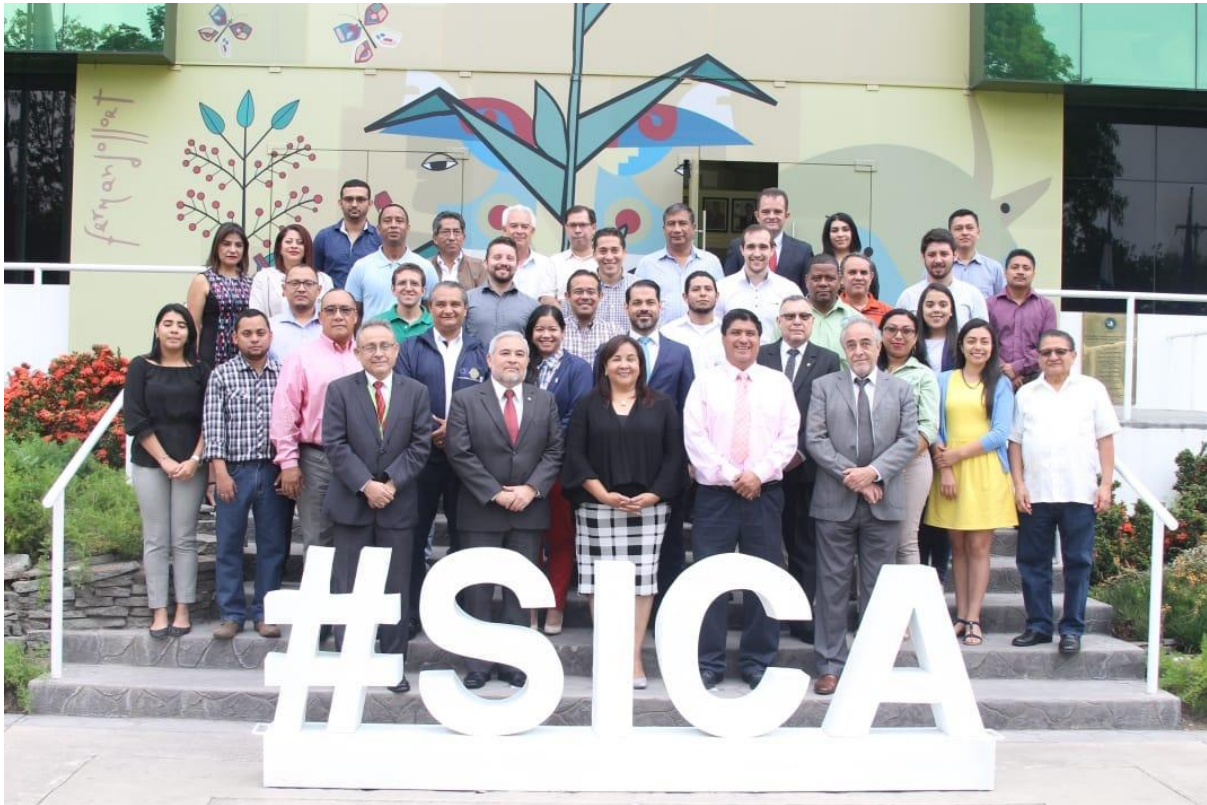
Figura 2. Grupo de trabajo que participó del LVIII Foro del Clima de América Central, Casa de Centroamérica SICA, San Salvador, El Salvador, abril 2019.